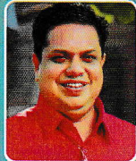
ഉദ്ഘാടനം ശ്രീ. എ. എൻ. ഷംസീർ ബഹു. സ്പീക്കർ